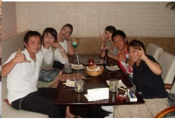
他のインターン生との懇親会風景